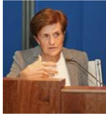
Adela Cortina (Filósofa. Valencia)