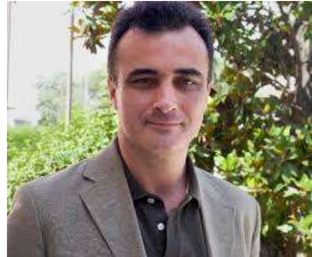
Sergio Minué Experto de la OMS en Servicios Integrados de Atención Primaria 2019