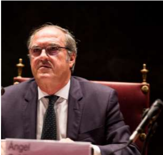
Angel Gabilindo Filósofo (Exministro de Educación) 2017