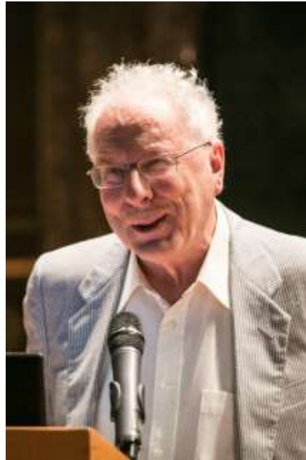
Javier Sádaba (Filósofo) 2017