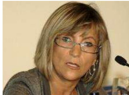
Verónica Casado (Premio 2018 mejor médico de familia del mundo)