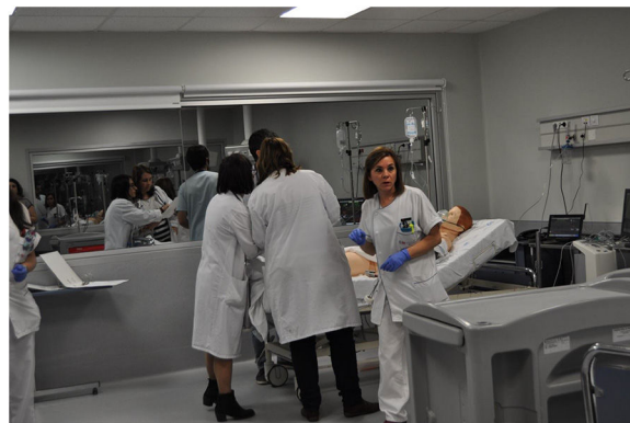
Figura 3 Actividad de simulación.

El simulador, sea de la complejidad que sea, es un mero instrumento. El mérito de un simulador no es su complejidad sino su utilidad y la frecuencia y aceptación para su uso. Para poder llevar a cabo los escenarios de simulación es preciso formar a los instructores-tutores tanto en el manejo del maniquí como en el diseño e implementación de las actividades. El esfuerzo requerido por los tutores para adquirir las habilidades necesarias es mucho mayor que para otras metodologías. El tiempo necesario para planificar y ejecutar cada actividad es elevado. En resumen, es necesario dotar de importantes recursos materiales, humanos y económicos para poder desarrollar y mantener en el tiempo cualquier actividad de simulación.