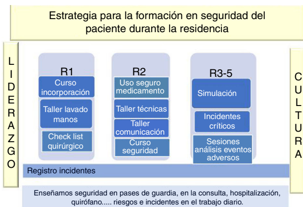
Figura 3 Estrategia para la formación en seguridad del paciente para los residentes del Hospital Universitario Fundación Alcorcón.